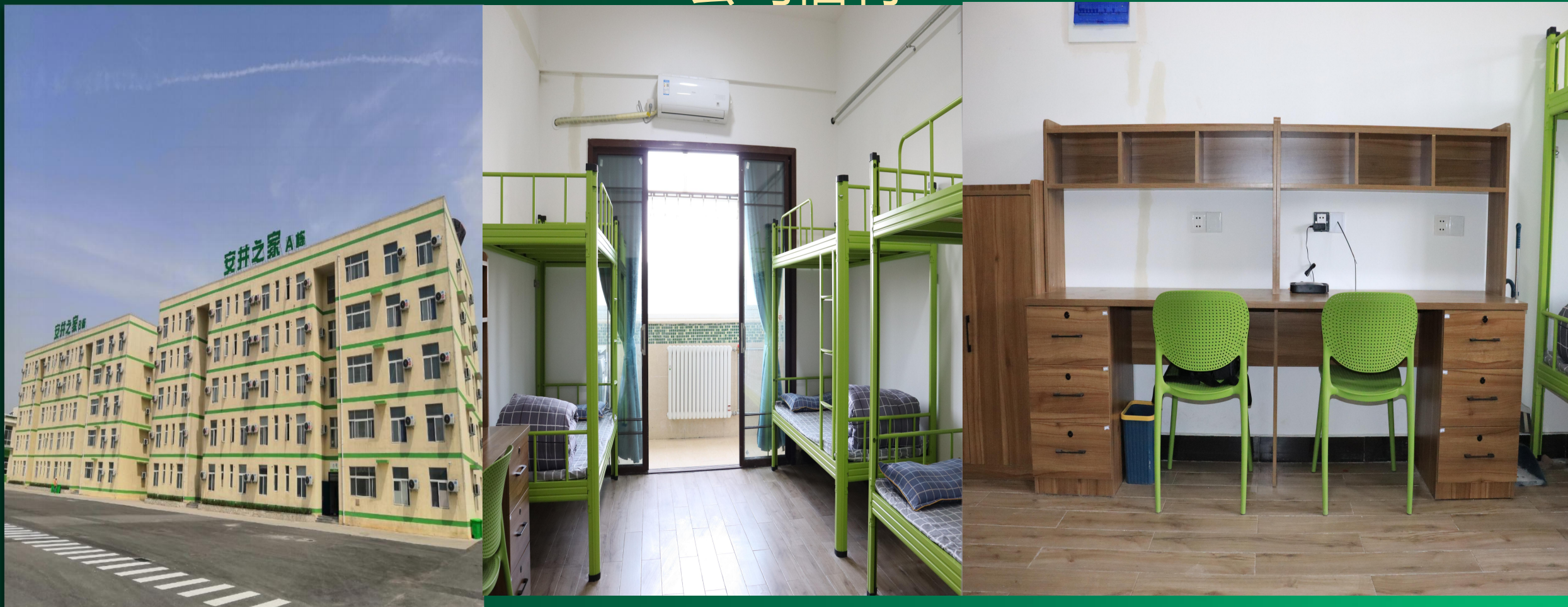
公寓式员工宿舍（配备热水器、空调、洗衣机、无线WiFi、独立卫生间）