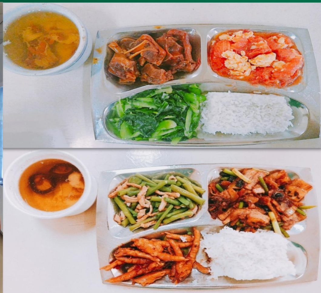
免费食堂，精致四餐（荤素搭配+汤）